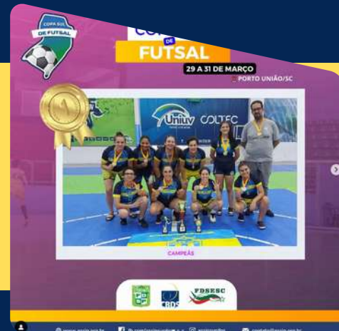
CBDS - Copa Sul de Futsal Feminino e Masculino Porto União/SC