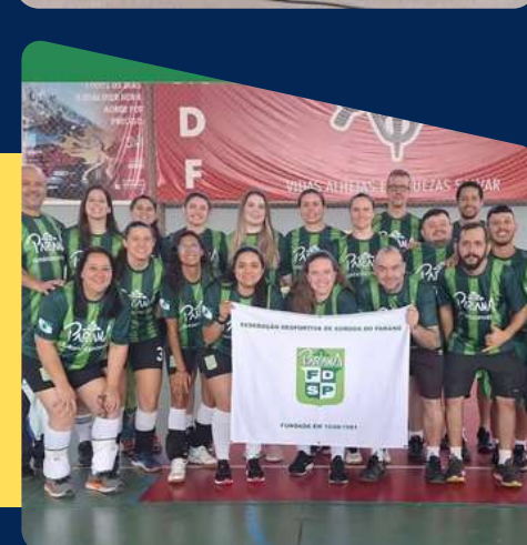
CBDS - Campeonato Brasileiro de Vôlei Masculino e Feminino Brasília/DF