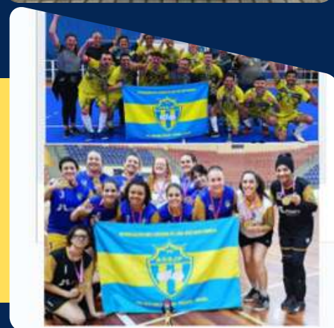
FDSP - Campeonato Paranaense de Futsal Masculino e Feminino São José dos Pinhais/PR