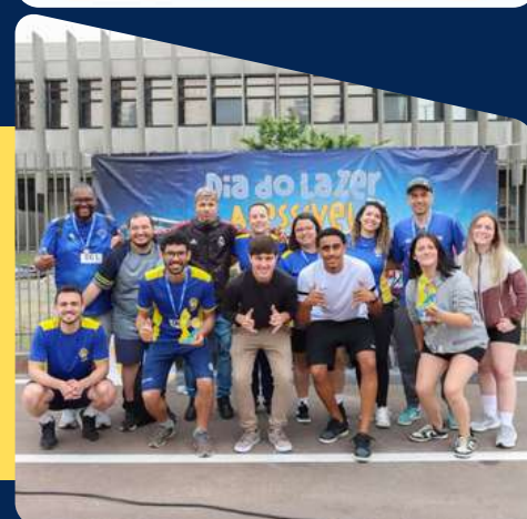
SMEL - Dia do Lazer Acessível São José dos Pinhais/PR