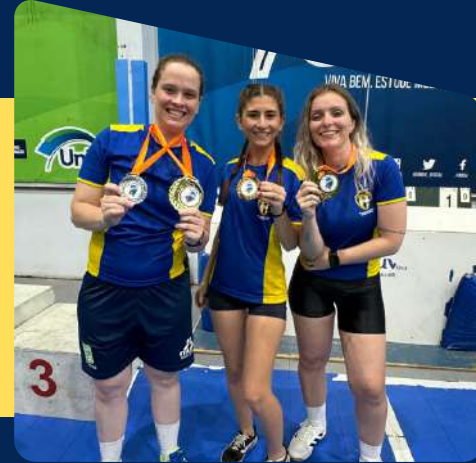
CBDS - Copa Sul de Tênis de Mesa Feminino Porto União/SC