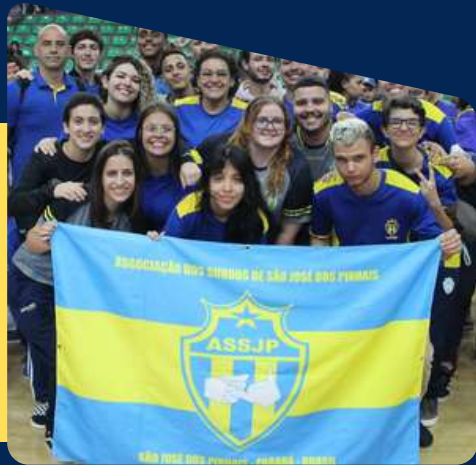
FDSP - Copa Paraná de Futsal de Surdos Feminino e Masculino Toledo/PR