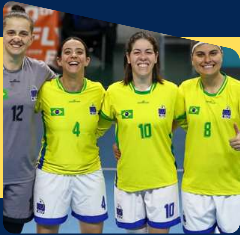
Winter Deaflympics 2023/2024 Futsal e Xadrez Erzurum, Turquia