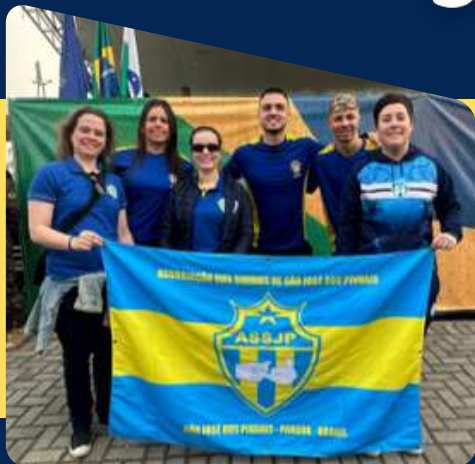
Desfile Cívico São José de Pinhais/PR